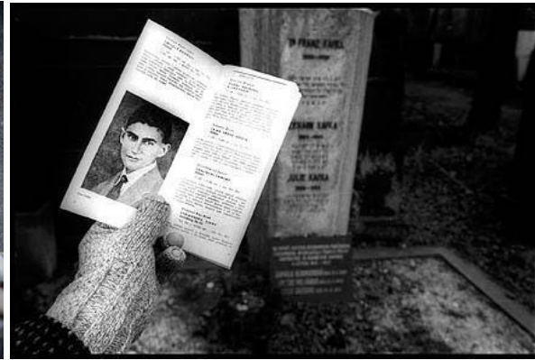
Top row: Bohuslav, Ukraine; Chisnau, Moldova. Bottom row: Szombathely, Hungary; Prague, Czechia